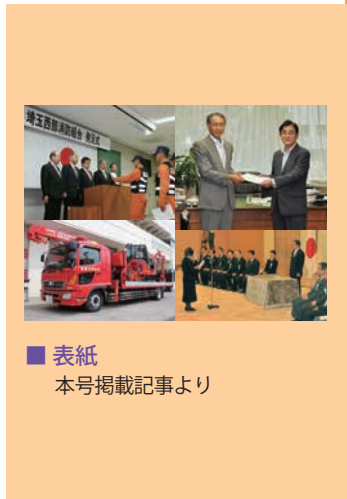
■ 表紙 本号掲載記事より